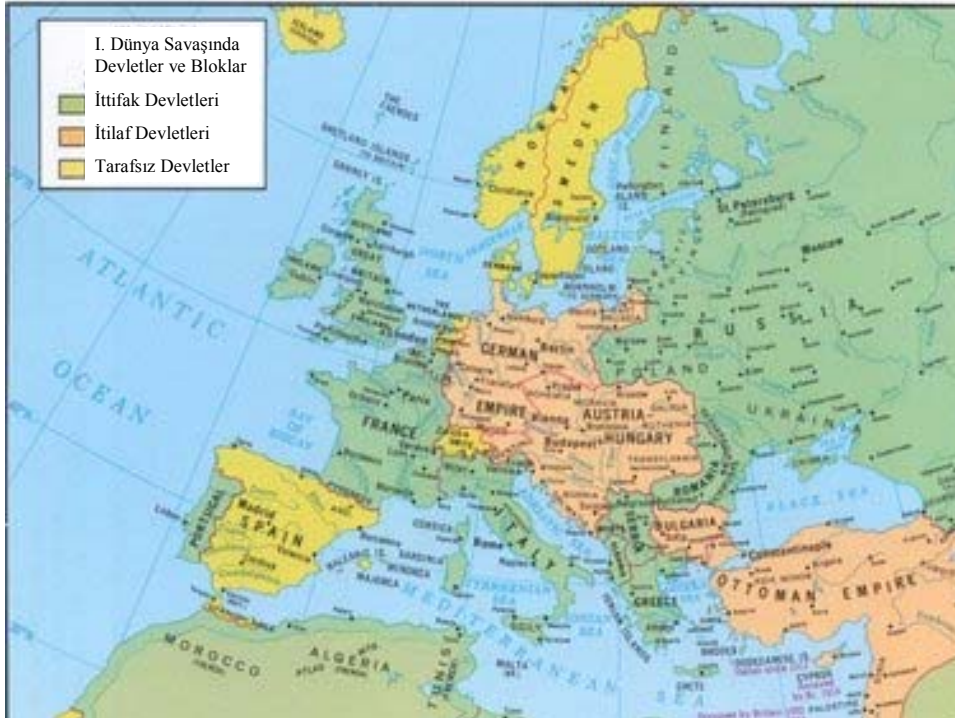
Savaş Sırasında Taraflar

Buna karşılık Almanya, Osmanlı Devleti ile ilişkilerini yoğunlaştırmaya ve geliştirmeye dönük ciddi çaba harcıyordu. Bu durumda Osmanlı yönetimi de Almanya ile anlaştı ve yapılan görüşmeler sonunda 2 Ağustos 1914’de gizli olmak kaydıyla bir Türk-Alman İttifak Antlaşması imzalandı. Osmanlı hükümeti adına imzalanan bu anlaşma, askeri yönetimin liderleri tarafından kabul edilmiş ve başlangıçta hükümetten gizlenmiştir. Sadrazam Sait Halim Paşa’nın bile olaylardan geç haberdar olduğu bilinmektedir.